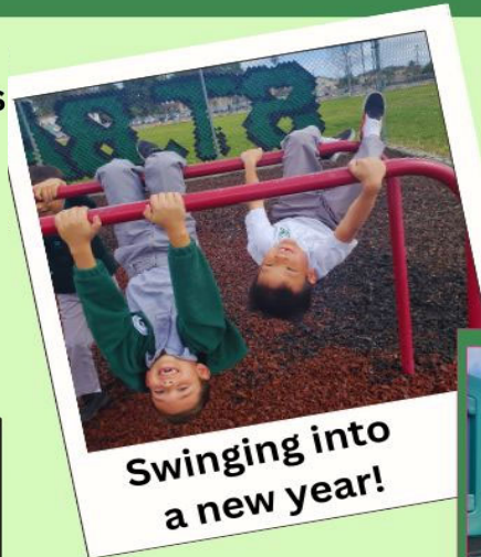
Swinging into a new year!